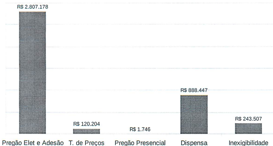
Gráfico nº 2 - Despesas liquidadas por modalidade de licitação e contratação direta em 2018*

* Incluindo os procedimentos iniciados em exercícios anteriores com liquidação em 2018.